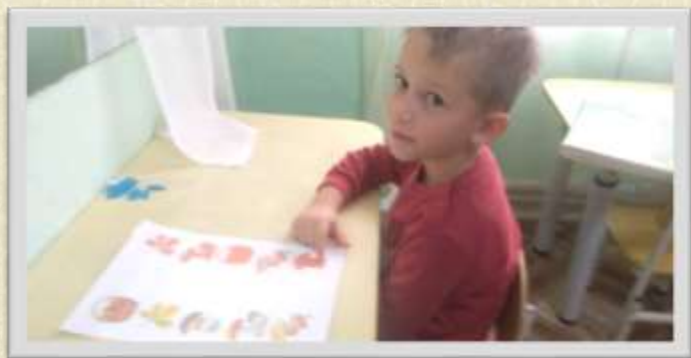
Составления предложения с опорой на схему