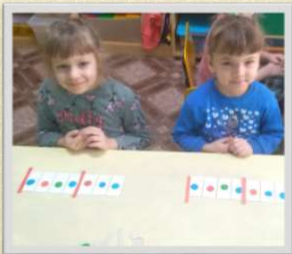
Звуковой анализ слова