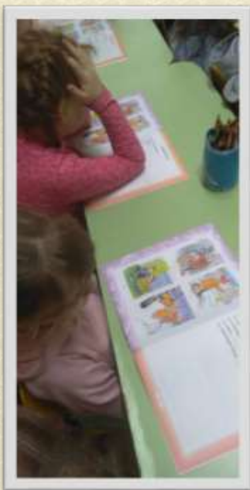
Составление рассказа по альбому Теремковой