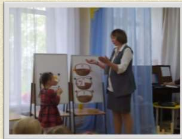
Деление слов на слоги